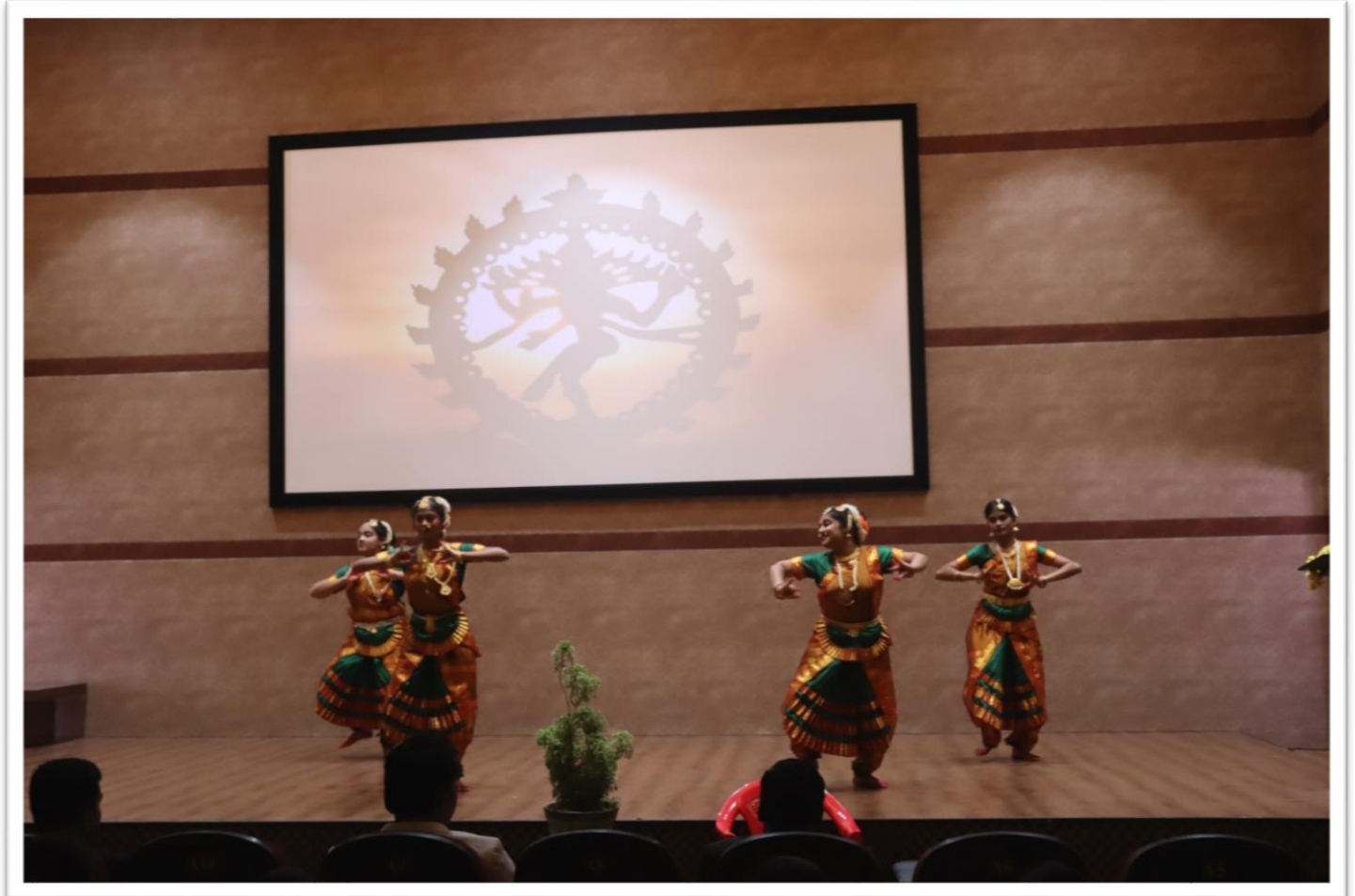
Invocation Dance by 3 rd Semester AIML Students