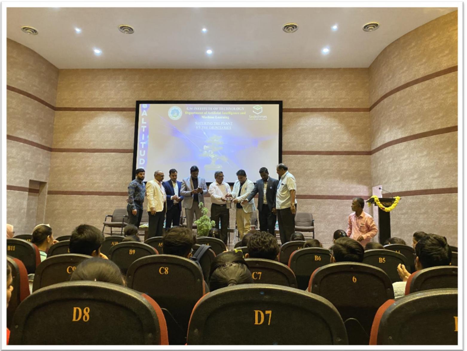
Inauguration by watering the Plants